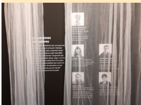
Plafó sobre alertadors de l'exposició "Corrupció! Revolta ètica"

Persona denunciante és la persona física que comunica o revela públicament informació sobre infraccions, obtinguda en el context de les seves activitats laborals.